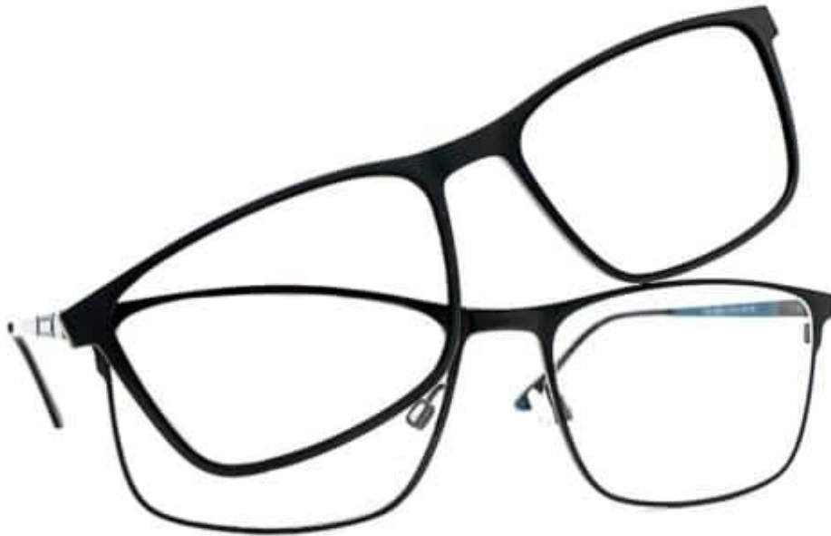
OnTop-Clip magnetisch

„Dies ergibt eine herausragende Lösung für alle Gleitsichtbrillen-Kunden, die kurzzeitig wechselnde Sehsituationen haben. Es existieren viele Clip-Variationen auf dem Markt. Dadurch lassen sich nahezu alle Gleitsichtbrillen mit den OnTop-Vorsatzgläsern optimieren.“